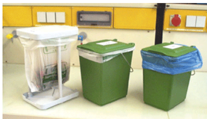
Obr. 1 Domácí systémy odpadkových košů na bioodpad zařazené do výzkumu: BS-COM, BS-BK a PE-BK (z levé strany).

Otázky týkající se hygienických aspektů košů a nádob na organický odpad vyvstaly v momentě, kdy se rozšířil sběr tříděného odpadu od zdroje (v domácnostech). Volbou vhodného systému sběru a častějším vyprazdňováním nádob s bio-odpadem lze předejít mnoha negativním průvodním jevům jako jsou zápach a zvýšený výskyt plísní.