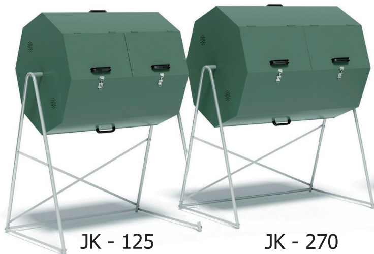
JK - 125