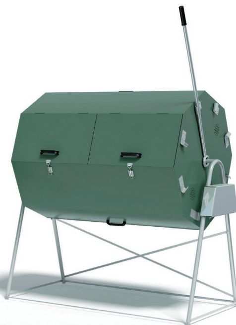
JK - 400